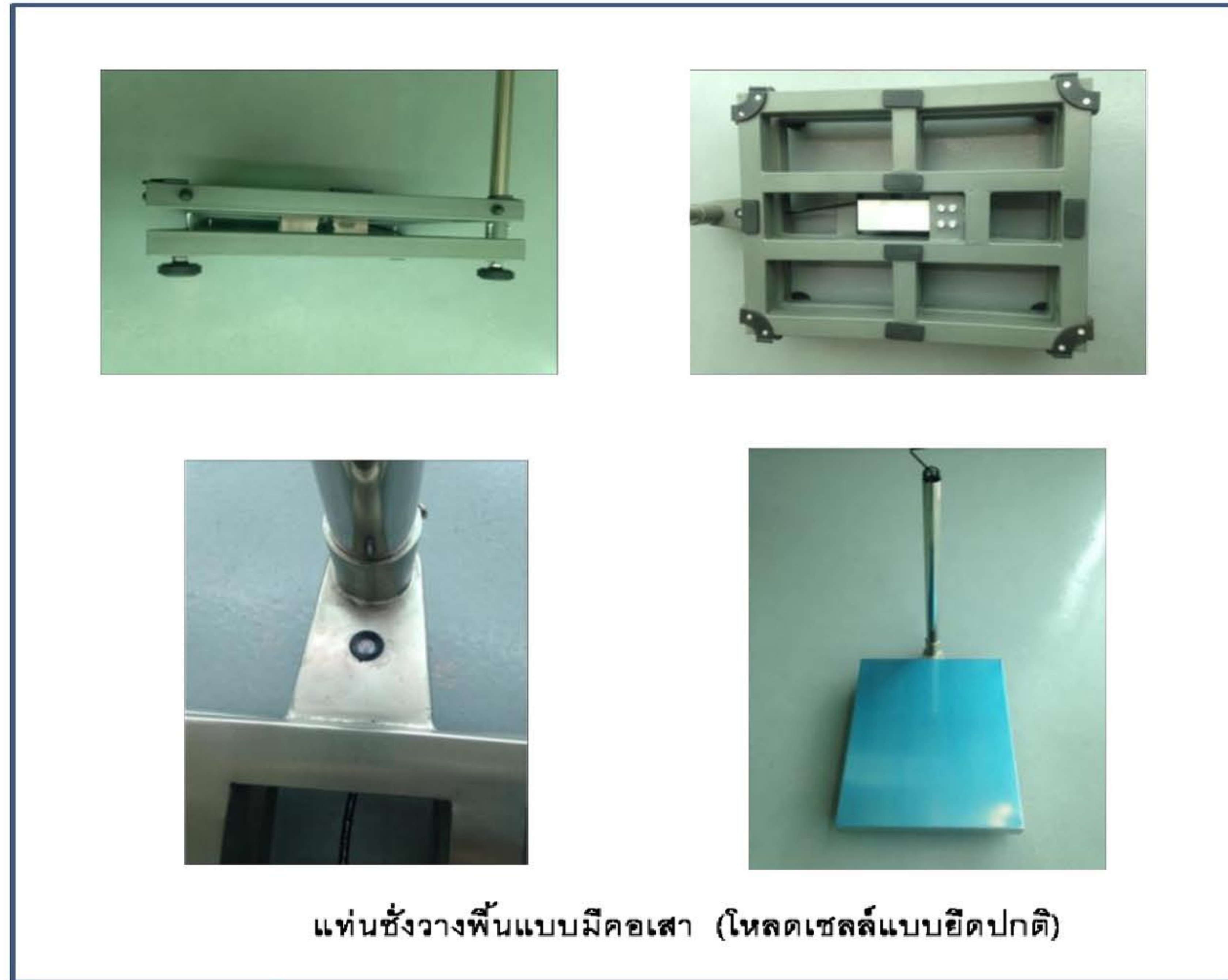
แท่นชั่งวางพื้นแบบมีคอกเสา (โหลดเซลล์แบบยึดปกติ)